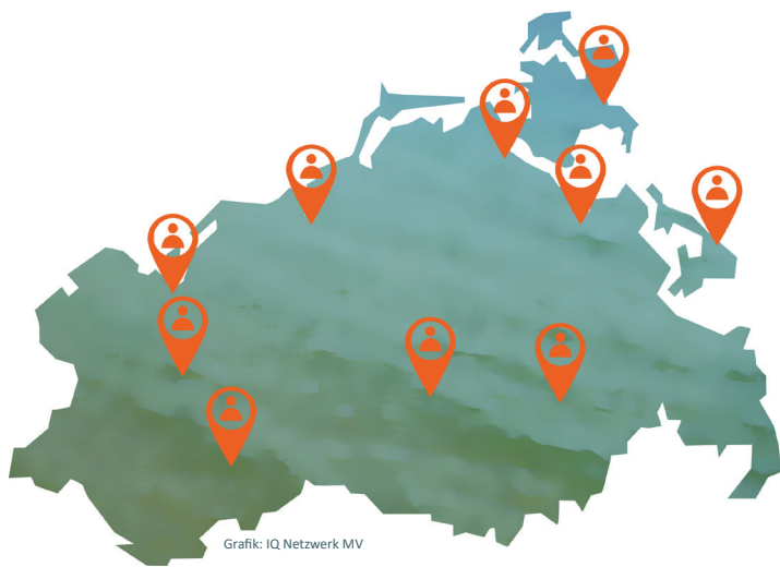
Grafik: IQ Netzwerk MV